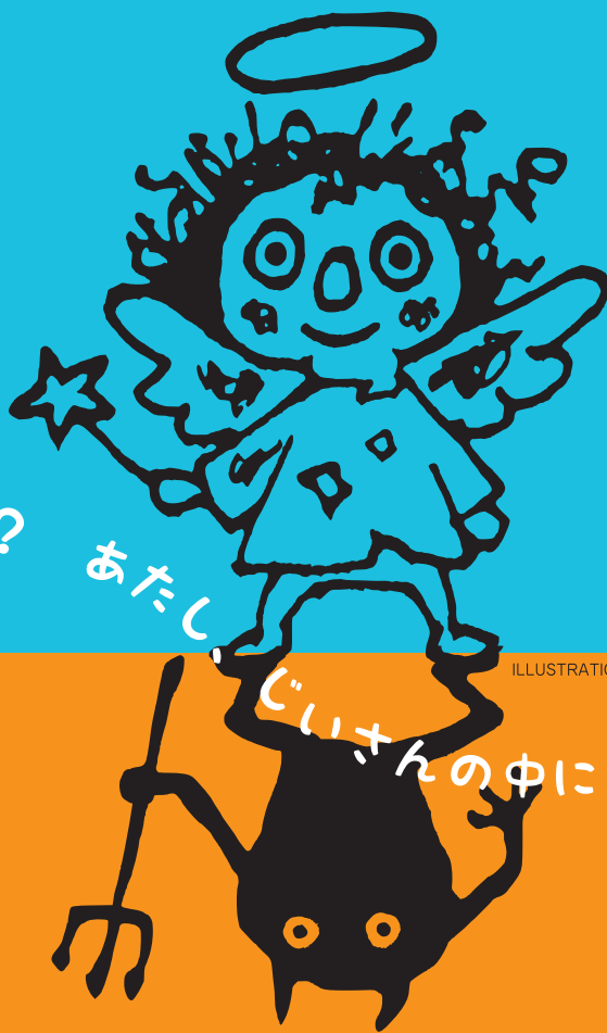
ILLUSTRATION © Kenji Miki