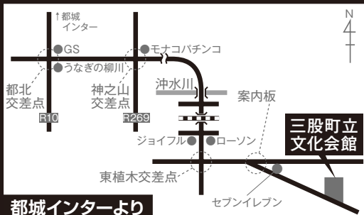
都城インターより

※WEB予約可 http://www.town.mimata.lg.jp/bunka/