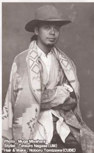
Stylist: Tetsuro Nagase (UM) Hair & Make: Noboru Tomizawa (CUBE)