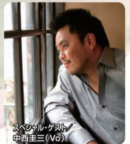
スペシャル・ゲスト 中西圭三 (Vo)