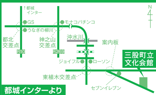
都城インターより

※電話予約可 休館日(月曜日)を除く午前9時~午後5時 ※WEB予約可 http://www.town.mimata.lg.jp/bunka/