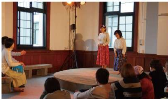
みやざき◎まあるい劇場「素敵な日曜日」 (2021.4 県庁5号館)